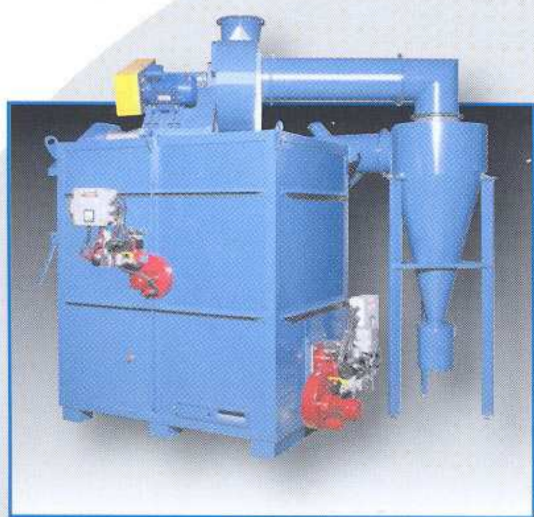
vista da dx - bruciatori/right side burners view

Hot bottom sole incinerator furnaces ILO SC 03 - 06