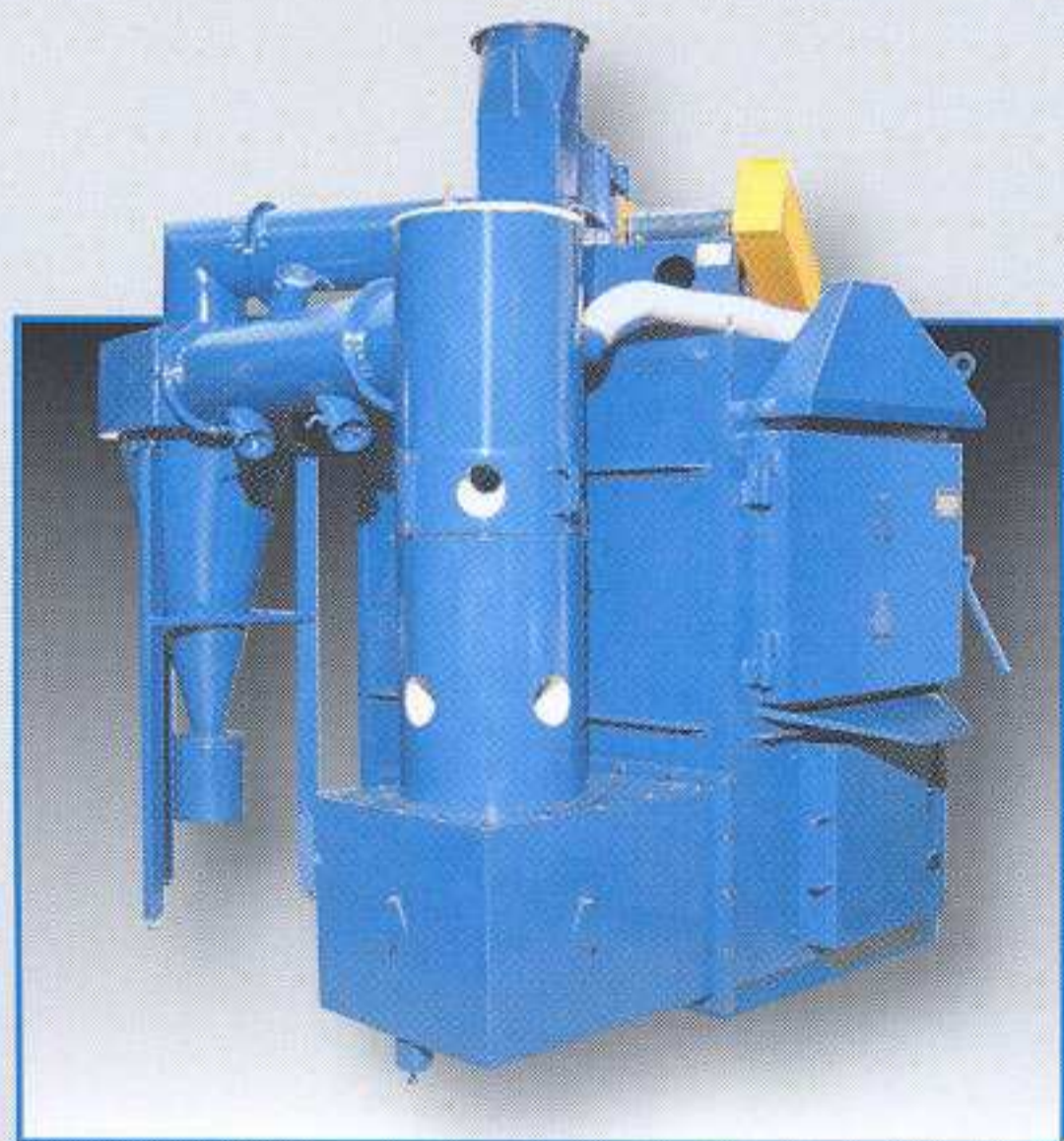
vista da sx - cicloni/left side cyclones view